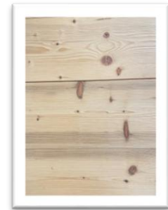
Epicéa chablis brossé