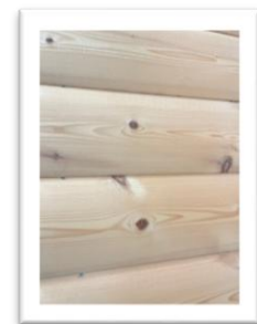
Epicéa raboté profil bombé