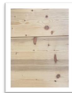
Epicéa chablis brossé